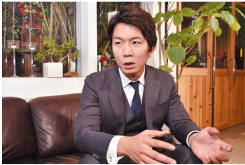
「携帯番号から発信するため、広範囲に販促でき、開封率も高いため、休眠層の掘り起こしが能動的に行えます」と語るケイビーカンパニー株式会社・北島万乗代表取締役。